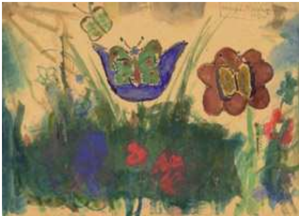
Margit Koretzová, 8, 4, 1933 - 4, 10, 1944.

Dibujo coloreado, realista y descriptivo de la llegada al campo de concentración. El ejercicio manifiesta una atenta observación por los detalles y la expresión personal de los individuos representados.