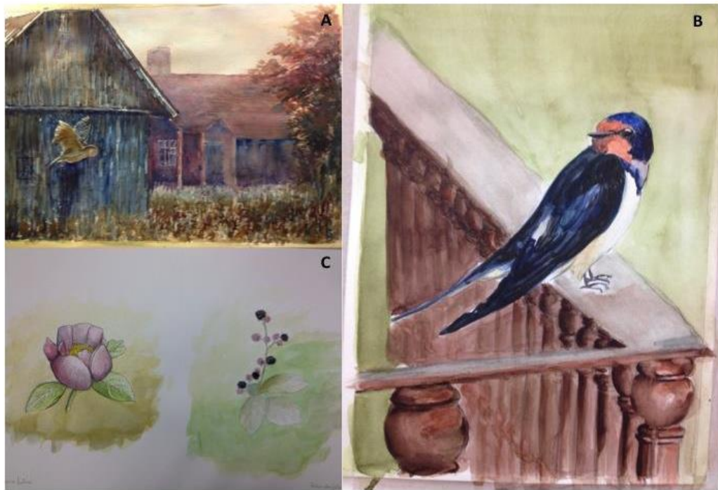
Figura 1.- Composición de lienzos realizados por los alumnos asistentes a los talleres de pintura de naturaleza durante los años 2011-2014.

La valoración global de los cursos realizados por parte del alumnado ha sido muy positiva, de modo que el 100% de los mismos consideró que la acción formativa se había ajustado adecuadamente a sus expectativas iniciales. De igual modo la valoración particular de cada curso obtuvo siempre valores en las más altas de las puntuaciones [“buena” (4) y “muy buena” (5)], con un porcentaje promedio para los cuatro años de realización del curso superior al 75% en la máxima de las valoraciones posibles (figura 2).