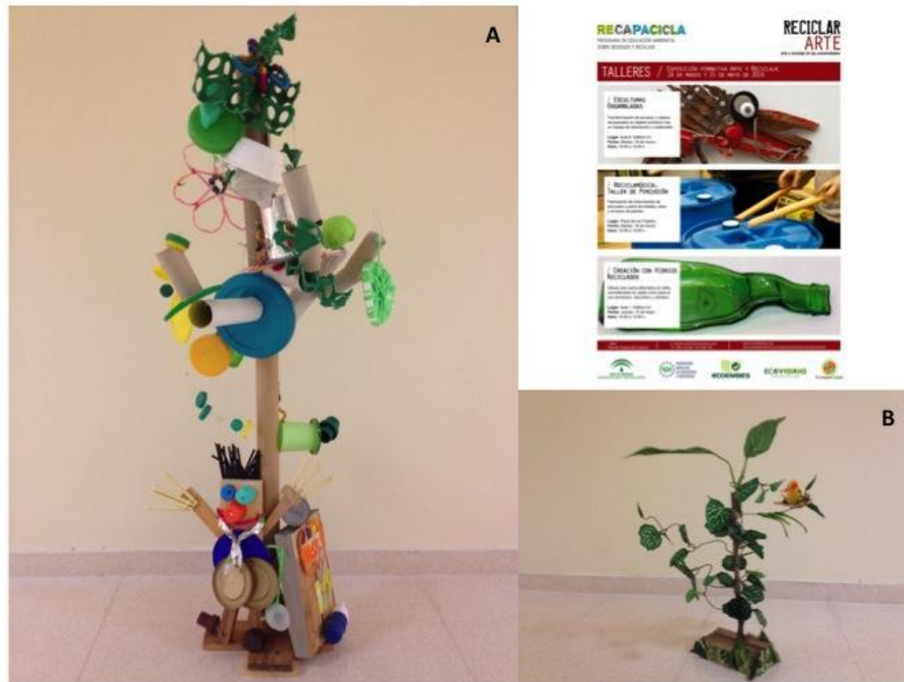
Figura 3.- Cartel promocional del programa RECAPACICLA en la Universidad de Jaén y algunas de las obras de naturaleza realizada por los alumnos asistentes a los talleres de esculturas ensambladas (recicla-arte).